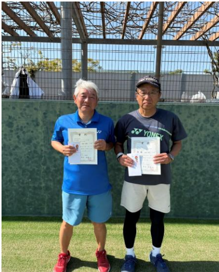
優勝 越地・錠内ペア