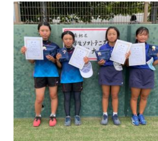
第3位: 新沼・豊島(PSC) 角田・矢野(出口)