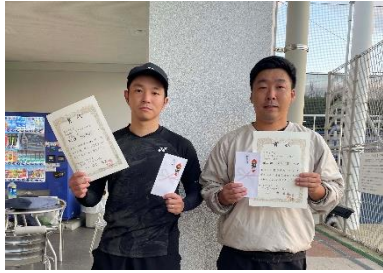
3位 久保・下店ペア