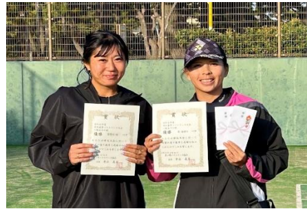
優勝 星・安倍川ペア